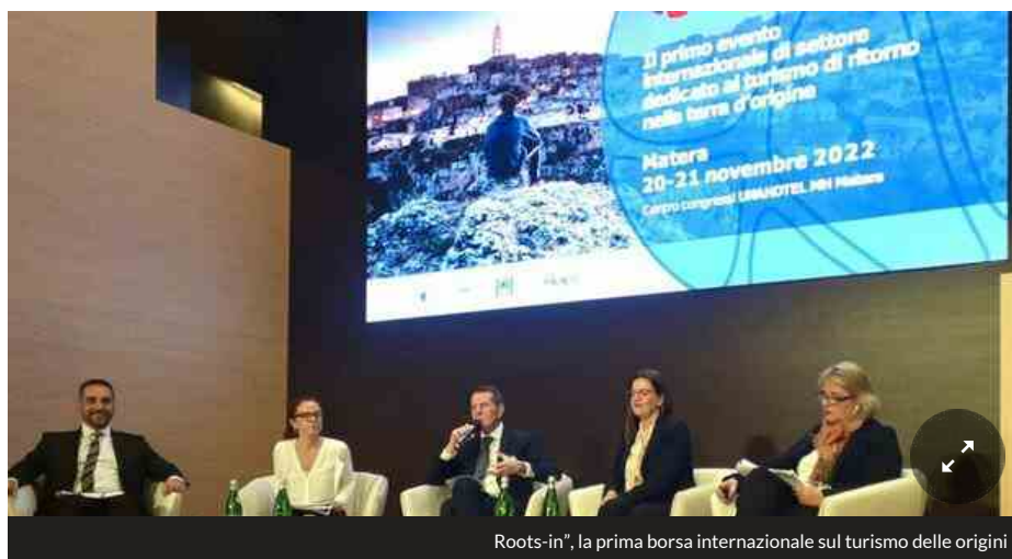
Roots-in”, la prima borsa internazionale sul turismo delle origini

Roots-in” è la prima borsa internazionale sul turismo delle origini